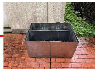
ピロティの残炭置き場