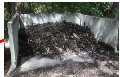
野外炊事場の残炭置き場