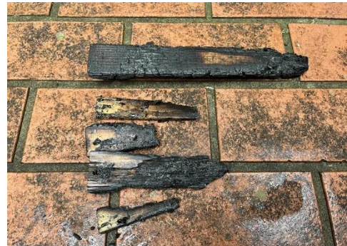
悪いもの（生の部分が残っている）