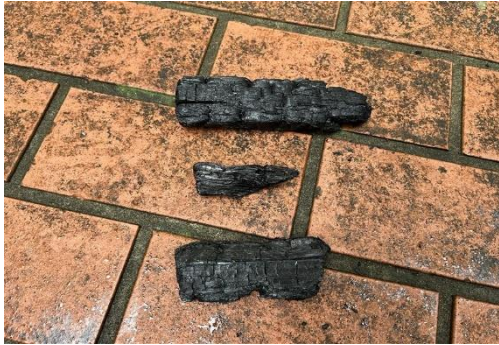
良いもの（すべて炭になっている）

一度火にくべた薪はすべて炭になるまで燃やし切る（余った薪は薪小屋のコンテナへ入れる）。