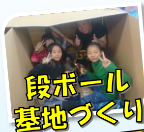
段ボール 基地づくり