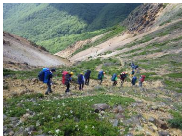
【那須連山縦走登山】

自然体験活動に興味があり、気軽に自然体験活動に参加できるようにして実施・計画した。様々な体験活動に参加することで自然体験活動への興味関心を高め、技術を身につけ、自然体験活動の普及を図ることをねらいとした。研修内容は「アウトドアクッキング」「小学生を支援し、那須連山縦走登山」「かまくら作りと雪中ハイキング」など全3回を通して、季節にあわせたプログラムを企画した。