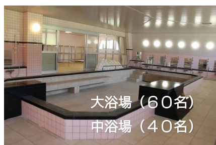
大浴場 (60名) 中浴場 (40名)

※学習室およびキビタルームには、机と椅子がございます。ホワイトボード・プロジェクター・スクリーン・アンプマイクも無料で貸出可。